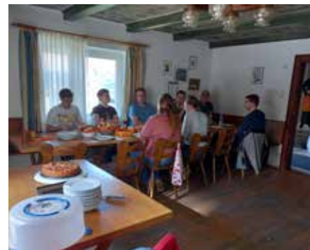
Stärkung im Kolpingheim