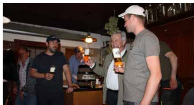
Das erste „verdiente“ Bier!