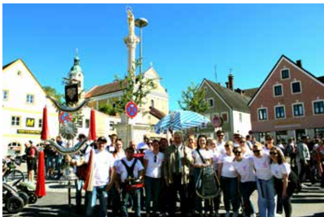
Schirmherrschaft für das HVT-Spielmannszug-Jubiläum