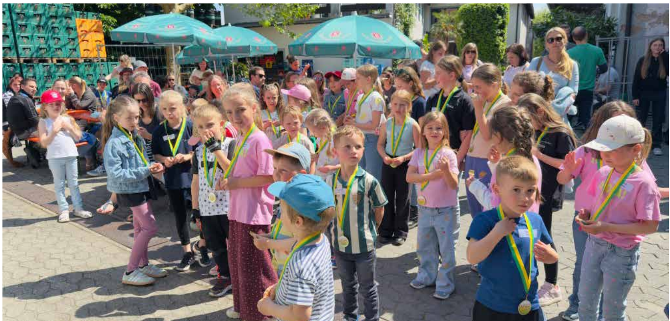
Medaillen für ALLE