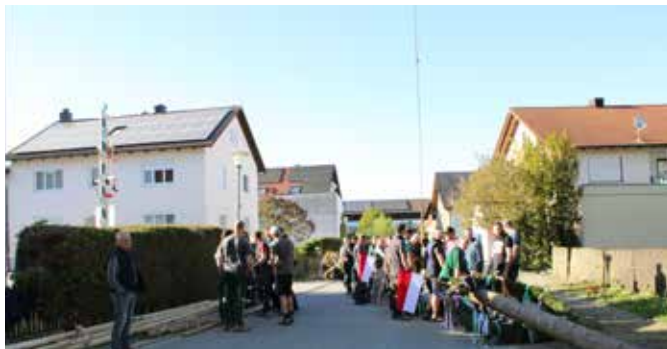
Gleich geht's los