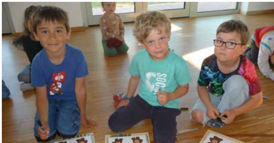
Nun fehlt noch der letzte Schliff an den Karten