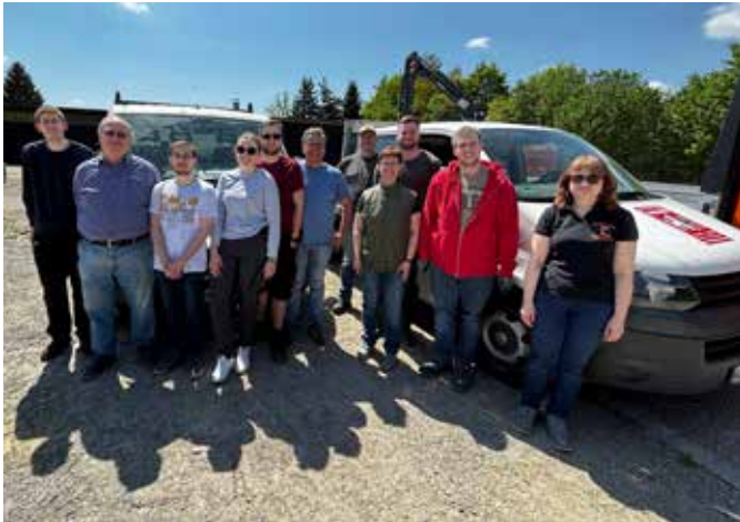
Die fleißigen Helfer

TEXT: EVA-MARIA WEBER