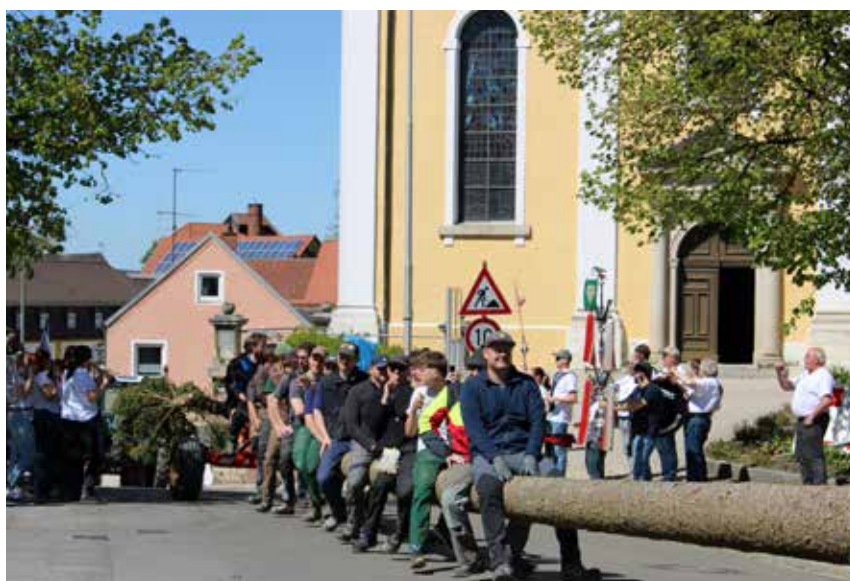
Durch Siegenburg durch!