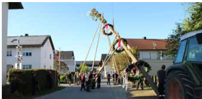
Mit „Schwalbe“ und „Stache“ gehts hoch.