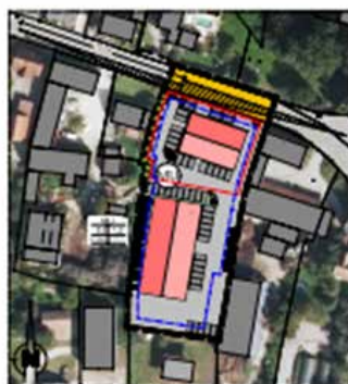
Bebauungs- und Grünordnungsplan "MU Landshuter Straße"

Bereich soll ein eingeschossiges Gebäude errichtet werden. Darin soll ein Baumarkt entstehen.