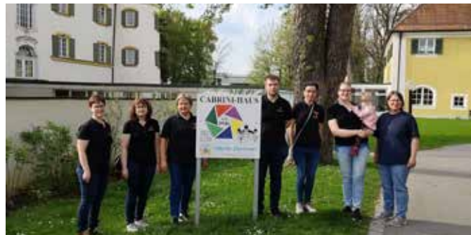
Ein Gruppenfoto zum Abschluss