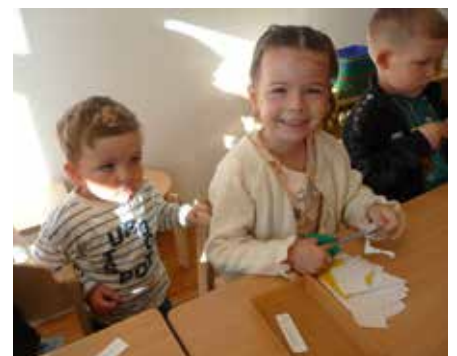
Wir schneiden Blumen für einen Türkranz aus Blumen