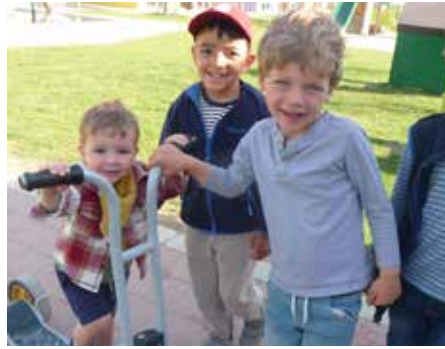
... und lernen unseren Kleinen das Roller fahren ...