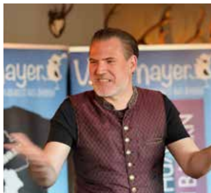
Der Kabarettist in Aktion