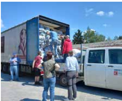
Einschichten, damit der LKW auch zu geht

Jetzt schon vormerken! Am 24.10.2026 sammeln wir wieder Altkleider in unserer Herbstsammlung.