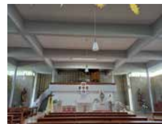
Sternenhimmel in der Kapelle

zum Jubiläum des Cabrinizentrums. Bei herrlichem Wetter folgte noch ein Rundgang über das große Gelände. Zum Abschluss unseres Besuchs wurde dann noch die Spendenpost überreicht. Die Spende wird für die Kinder des Cabrinizentrums eingesetzt. Wir bedanken uns nochmal recht herzlich für den tollen Empfang und den schönen Nachmittag.