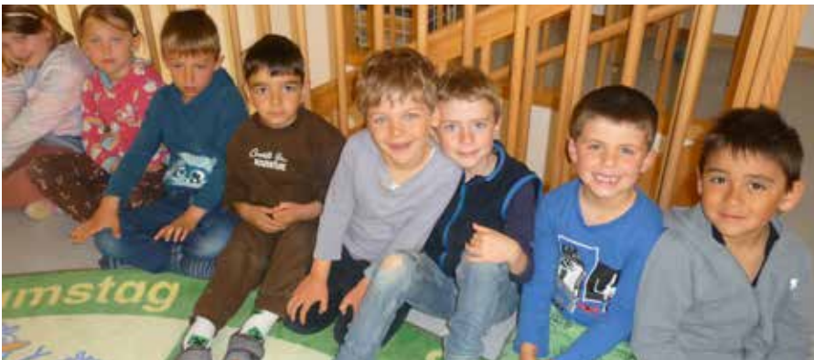
Im Morgenkreis besprechen wir, was unsere Eltern so besonders macht