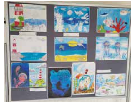
Einige der prämierten Bilder.