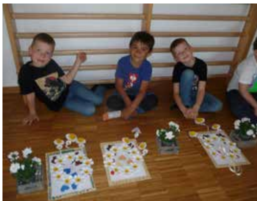
Und fertig sind die Mutter- und Vatertagsgeschenke