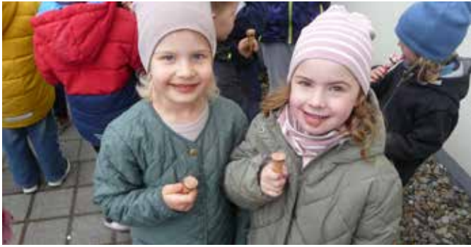
Zwischendurch stärken wir uns noch mit einem leckeren Eis...