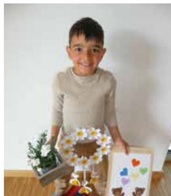
. ... Mit jedem Blümchen, das ich bring, mit jedem meiner Lieder ...