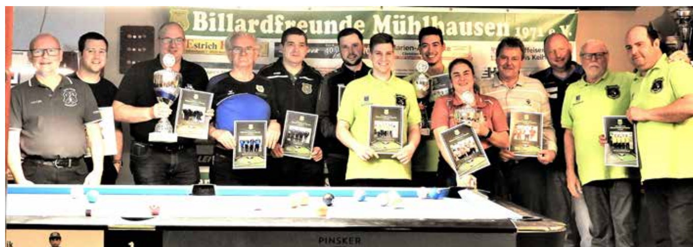
Siegerehrung beim Jubiläums-Turnier zum 50-Jährigen der Billardfreunde Mühlhausen 1971