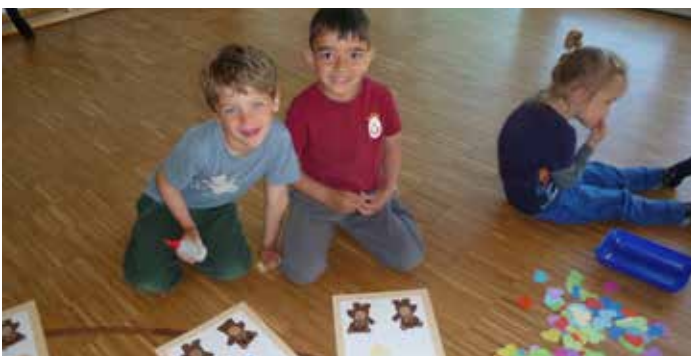
Für jedes Familienmitglied klebten wir ein Herz