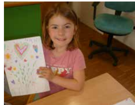
So schöne Bilder können Mamas immer brauchen