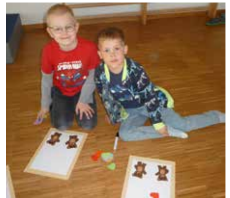
Wir basteln eine Karte für Mama und Papa