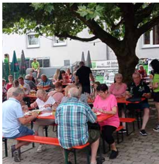
Unter der Platane lässt es sich gut feiern !

Die Billardfreunde Mühlhausen feiern am Sonntag den 14. Juni das Hoffest und laden alle Mitglieder, Freunde, Siegenburger Vereine und Bürger aus nah und fern ein. Los geht's diesmal am Sonntag um 16 Uhr. Gefeierte wird im Billardheim Hof unter der Platane in der Hopfenstr. 3 neben der Brauerei Schmidmayer. Ab 18 Uhr treffen sich die Siegenburger Vereine zur dritten Station bei der Marktmeisterschaft. Für Essen und Trinken ist gesorgt. Die Billardfreunde freuen sich auf zahlreichen Besuch, auch von Bürgern aus der Marktgemeinde und Umgebung. Kinder und Jugendliche können wieder kostenlos Billardspielen, ferner gibt es einen Losstand für Kinder.