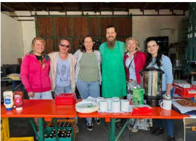
Ohne freiwillige Helfer geht's nicht