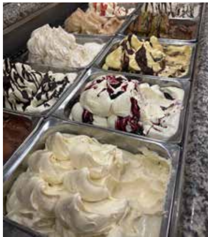
Feinstes handgemachtes Eis