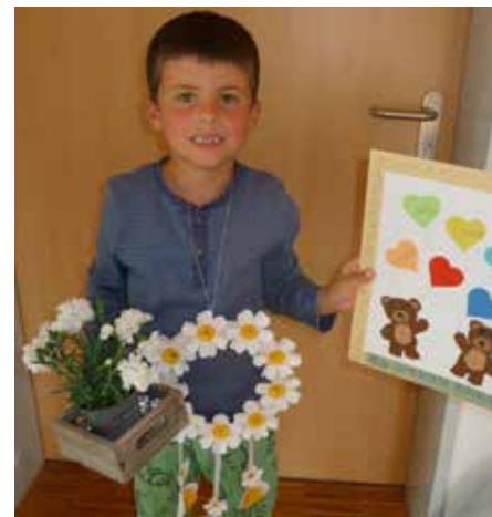
Liebe Mama, ich hab dich lieb, ich hab dich lieb, ich sag dir's immer wieder ...