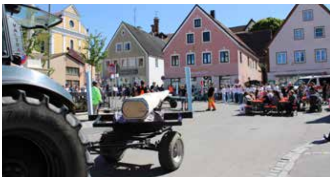
Der Maibaum kommt am Marktplatz an.