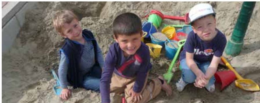
... und kochen unseren Mamas im Sandkasten Sand-Kaffee