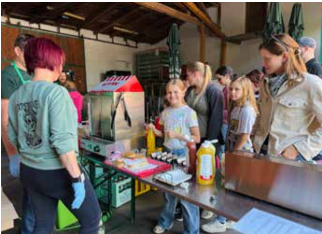
Hotdogs & Pommes